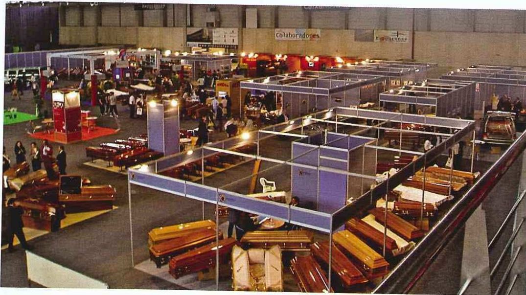
La pasada edición de la feria, en 2007, congregó a más de 2.000 profesionales y un total de 65 empresas expositoras

rosas exposiciones importantes en sus diferentes ámbitos de actividad. ¿Cómo encara Funergal 2010 esta situación financiera?, ¿se ha dudado sobre la celebración de la misma el próximo año?